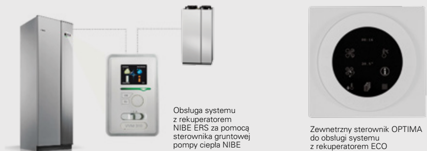
Obsługa systemu z rekuperatorem NIBE ERS za pomocą sterownika grunтовой pompy ciepła NIBE